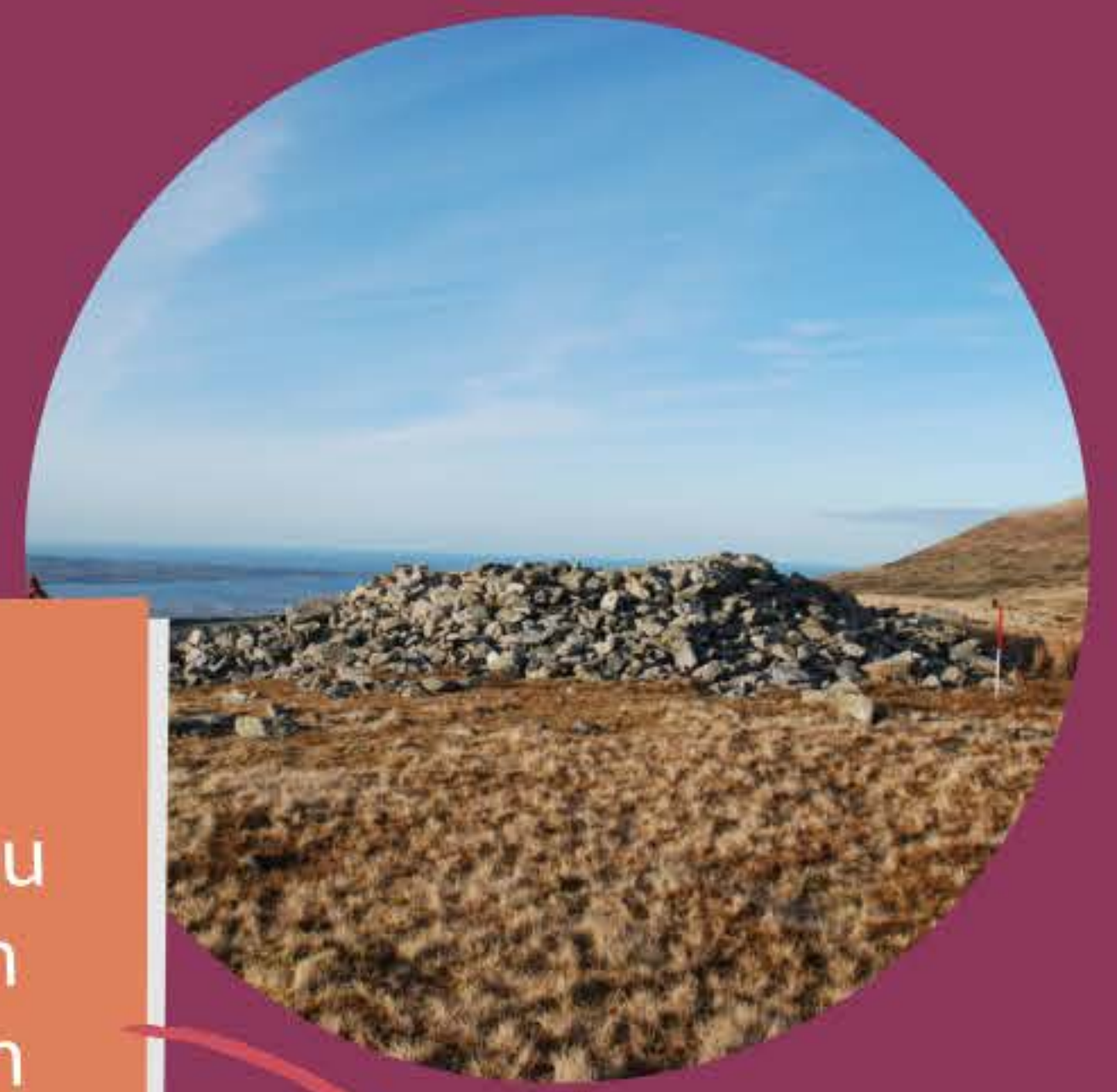
Carnedd gynhanesyddol, Moel Faban.jpg

Darllenwch y ddogfen ganllawiau a sicrhau bod eich syniad prosiect yn cwrdd â gofynion y CPT