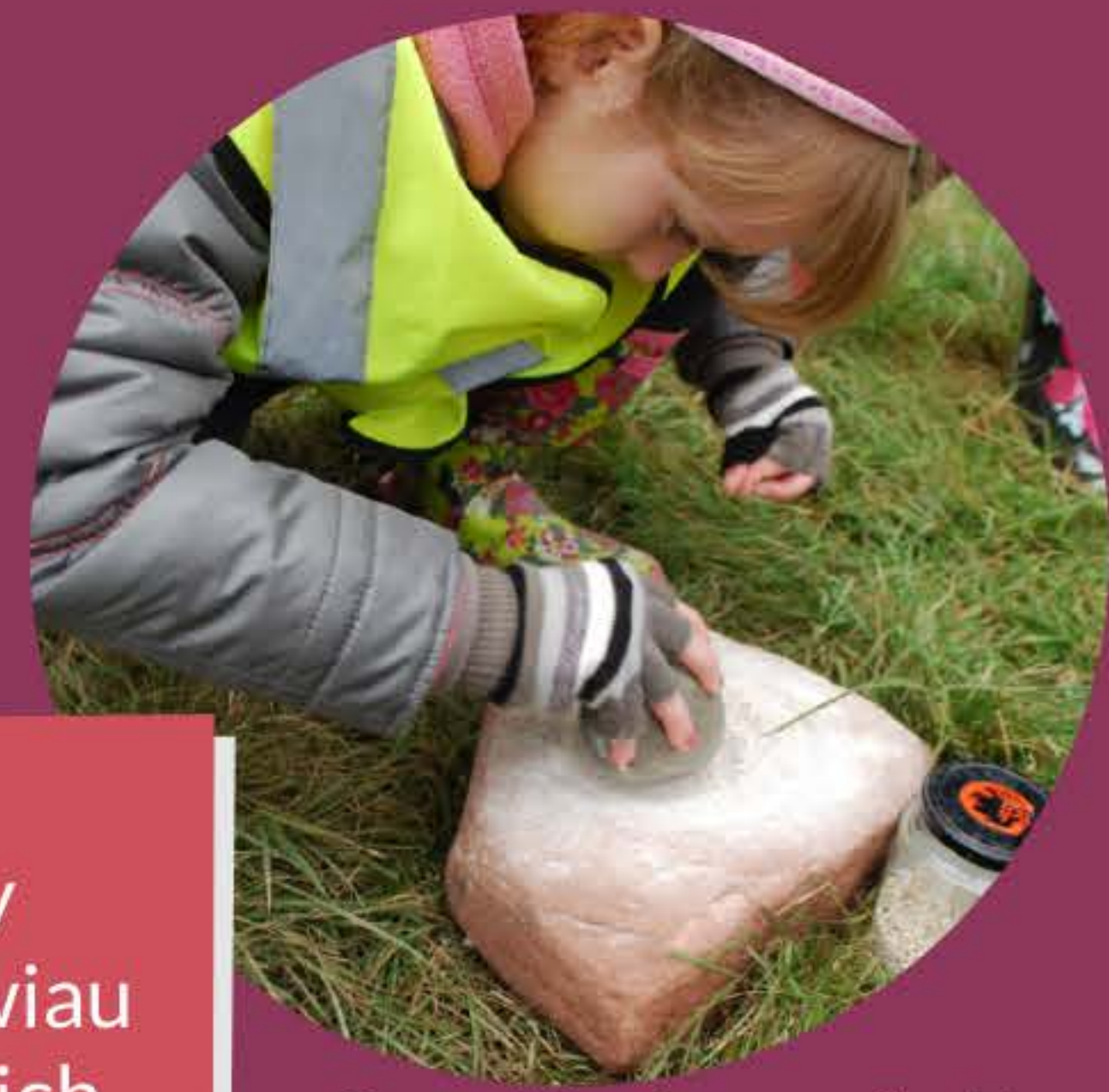
Gwneud blawd o rawn y ffordd draddodiadol © APCE.JPG

Darllenwch y ddogfen ganllawiau a sicrhau bod eich syniad prosiect yn cwrdd â gofynion y CPT