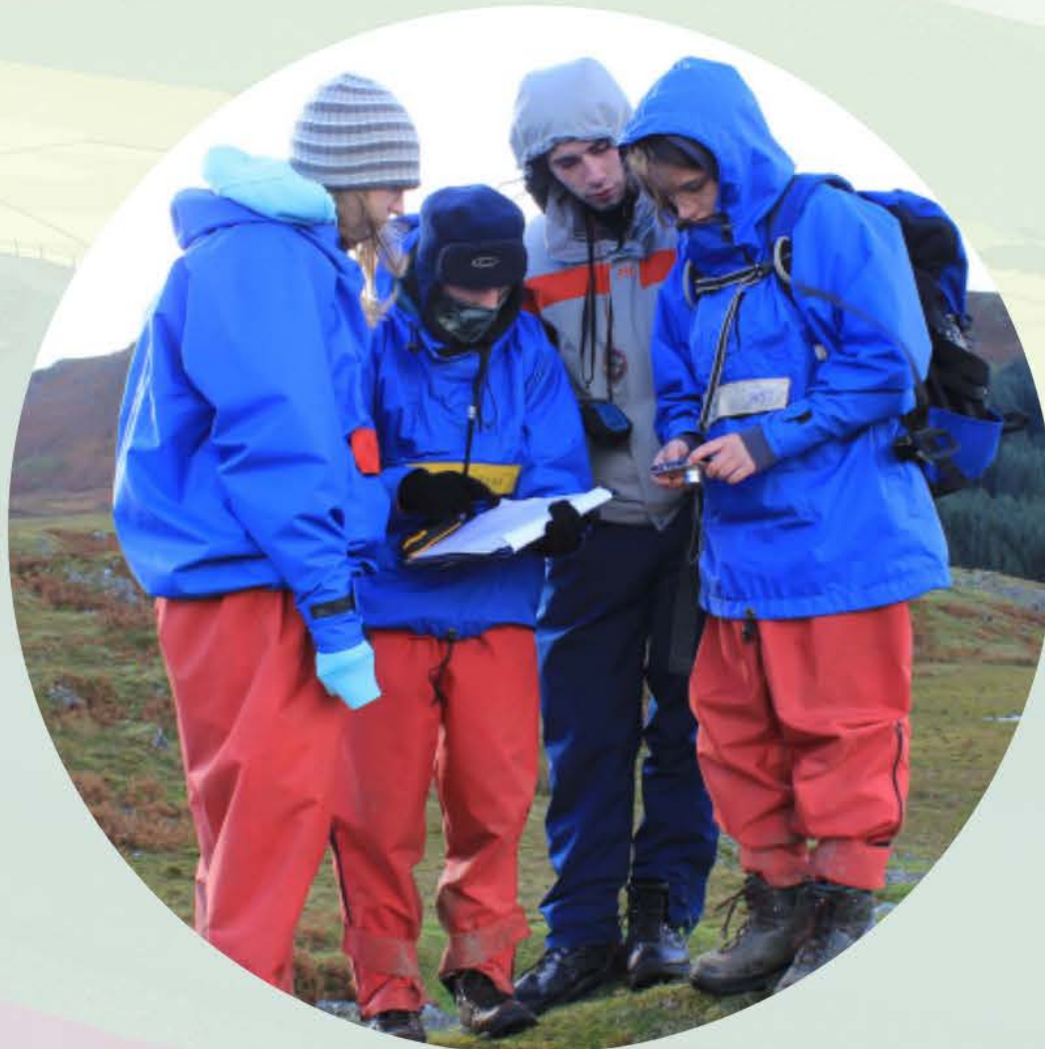
Arolygu safle archeolegol

Peidiwch â chynnwys TAW oni bai nad ydych yn gallu hawlio TAW yn ôl.