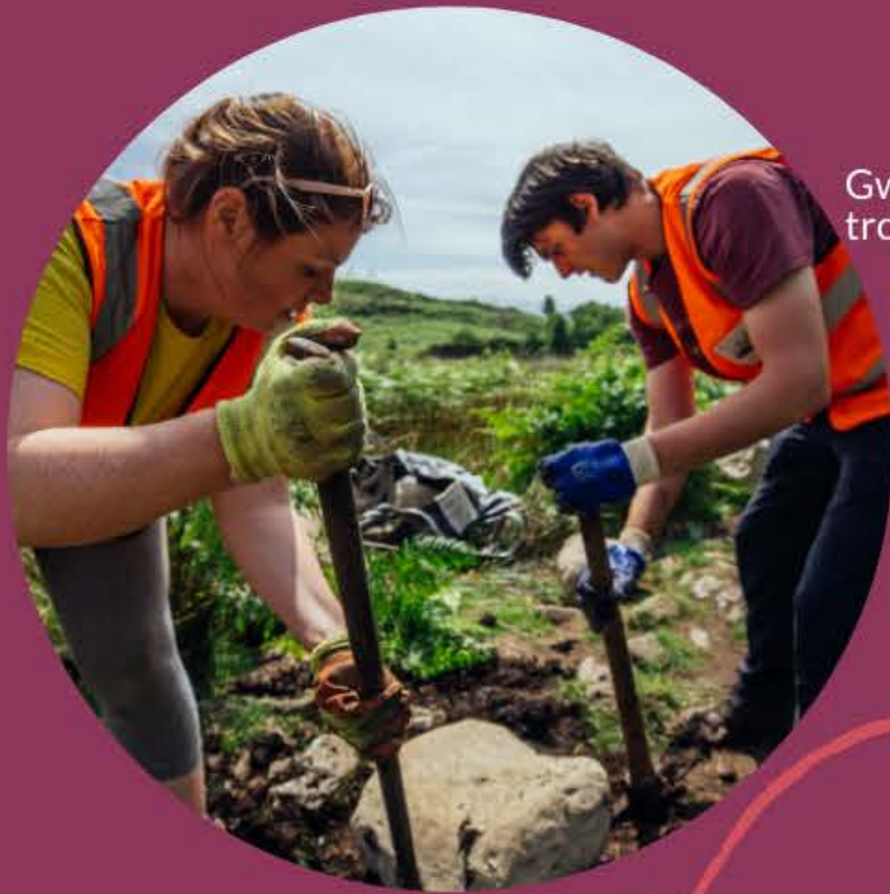
Gwirfoddolwyr yn atgyweirio llwybr troed

Fis ar ôl y dyddiad cau bydd y Panel Grantiau yn ymgynnull i dderbyn neu wrthod eich cais